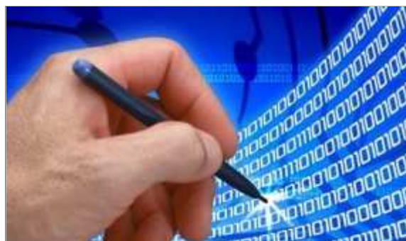
En el proyecto colaboran ocho administraciones de España, Francia y Portugal.

Se hablará allí de la e-administración y de la participación ciudadana. Además, también habrá una exposición y un debate con varios casos de buenas prácticas ya experimentadas por otros organismos.