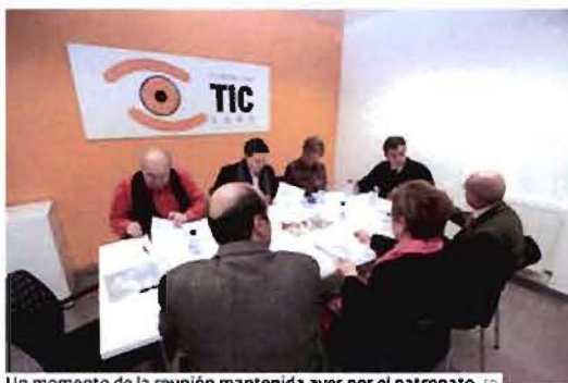
Un momento de la reunión mantenida ayer por el patronato.

CONCELLOS. Por otra parte, en las últimas semanas se inició una campaña de información entre los Concellos lucenses, «ofrecendo asesoramento técnico e poñéndonos á súa disposición para producir contidos que os promocionen economicamente