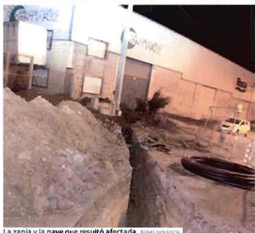
La zanja y la nave que resultó afectada. SEBAS SERRANO

Las jornadas se organizan a partir de un programa europeo que lidera la Diputación de A Coruña y en el que participa el Concello y el organismo provincial de Lugo.