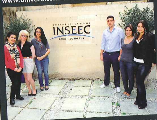
Des étudiants en deuxième année à l'Inseec ont décidé de créer un prix littéraire sur le thème "Entreprise, entreprendre"