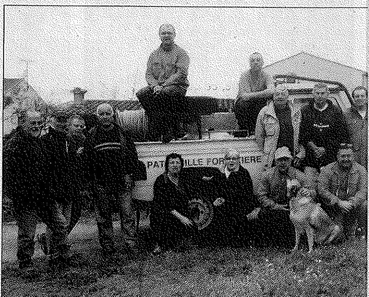
la section grimpe à un chiffre record de 29 patrouilleurs pour cette saison