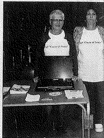
L'équipe du club « Cœur et santé »

Ensuite, les représentants de la Croix rouge venus avec le matériel, mannequin et défibrillateur ont permis à l'assistance de savoir comment réagir en présence d'une personne présentant un arrêt cardia-