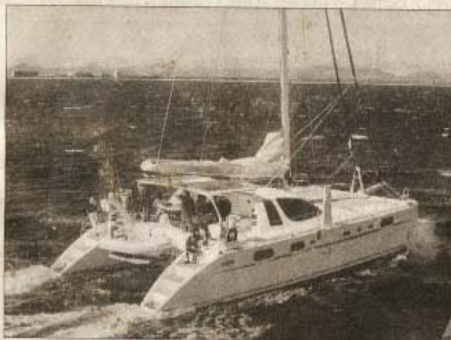
L'industrie de la plaisance engendre une activité économique et industrielle qui est considérable dans notre département et génère de très nombreux emplois. Photo

C'est pourquoi la fédération française des ports de plaisance va lan-