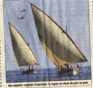
Une manière originale d'apprécier la région en allant de port à port.

LE PROJET → L'APLR va proposer des itinéraires allant de port à port