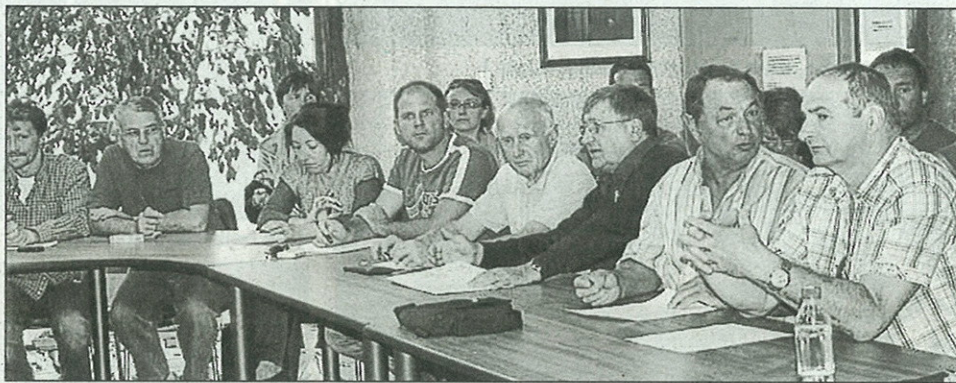
Une vue partielle des représentants d'associations

"Cette démarche s'inscrit dans le cadre du projet de