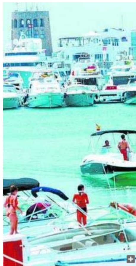
Vista del puerto marbellí.