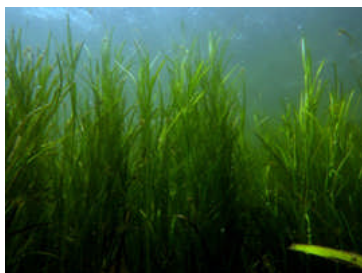
Zostera marina à Saint Laurent de Salanque (étang de Salses-Leucate)

En complément des cartographies de macrophytes réalisées dans le cadre du RSL et basées sur un maillage large, le syndicat RIVAGE a porté la réalisation d'une cartographie fine des herbiers de de l'étang de Salses-Leucate dans l'objectif d'initier un suivi régulier sur quelques zones à enjeu de ces prairies de biodiversité. Ce travail, réalisé dans le cadre du projet SUDO Eco-Lagunes, a été validé le 11 juillet 2011 et est désormais disponible pour consultation.