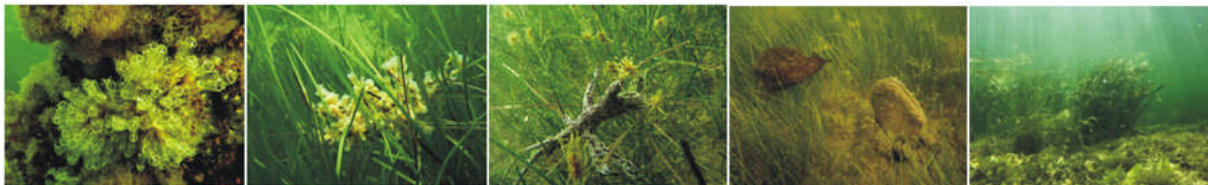
Biodiversité rencontrée dans les herbiers de l'étang de Salses-Leucate

La sensibilité et le risque des différentes zones identifiées dans l'étang ont été analysés de façon à aboutir à un classement de 5 ensembles de zones. Les différents ensembles se répartissent de zones très sensibles à faible risque de dégradation à des de zones peu sensibles (car déjà dégradées) à fort risque de poursuite de la dégradation.