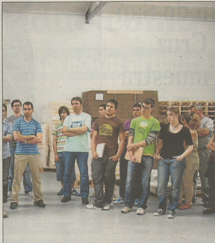
Los participantes durante la visita a la factoría de Unisolar.

Como novedad, esta tercera edición de las Jornadas de Energías Renovables se desarrollará en el marco del proyecto Redomic , financiado por el Programa Operativo de Cooperación Territorial del Espacio Sudoeste Europeo, lo que ha permitido la participación de alumnos procedentes de siete regiones de España, Francia y Portugal.