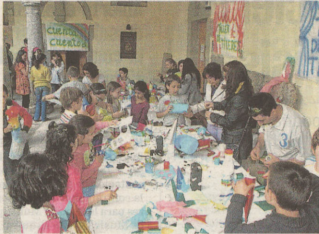
Los escolares celebraron el año pasado el día del Medio Ambiente.