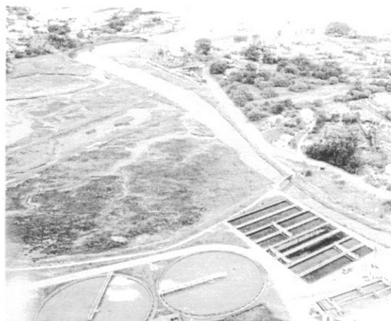
Primeira reunión do proxecto EnerBioAlgae na Estación de Ciencias Mariñas de Toralla. A dereita, vista parcial da depuradora augas residuais de Vigo.