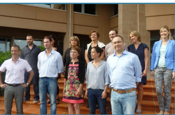
Os integrantes do Comité de Pilotagem reunidos em Agen (FR)

Também se conta com a valiosa colaboração da Chambre d'agriculture de Lot et Garonne . Trata-se de uma câmara consultiva para missões de desenvolvimento no mundo rural, atuando como assessor dos portadores de projetos e levando a cabo uma valorização dos diferentes representantes do Estado, da Região de Aquitania.